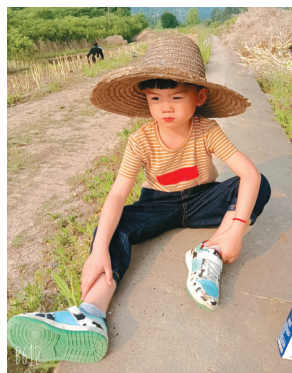
参赛萌娃们各种爆照萌化人心。

华堂、西部文化产业中心推出的“封面宝贝 兔be No.1”线下报名活动将正式开启，报名还能领奖品。从17日起，活动主办方将在成都伊藤洋华堂