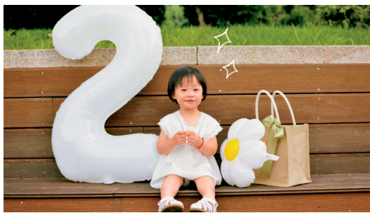
贴心小软妹“萌翻”你。

据了解,投票活动将持续到2月5日。活动结束后将以投票排行榜作为主要依据,评选出特别大奖1名,一等奖1名,二等奖2名,三等奖7名,前50名为“封面宝贝”推广大使。此外还将评选出10个“最佳人气奖”。特别大奖奖金高达1万元,获奖宝贝还有机会登上封面新闻APP开机屏。