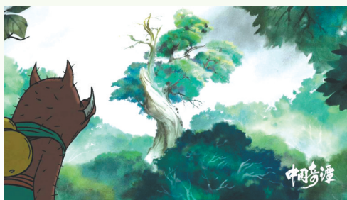
《小妖怪的夏天》剧照