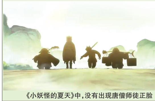
《小妖怪的夏天》中，没有出现唐僧师徒正脸