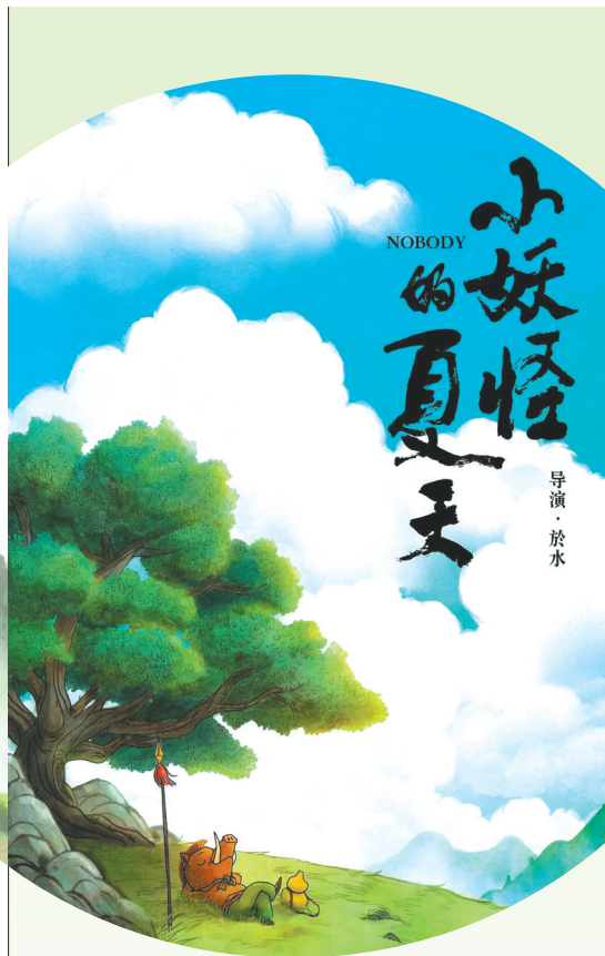
《小妖怪的夏天》海报