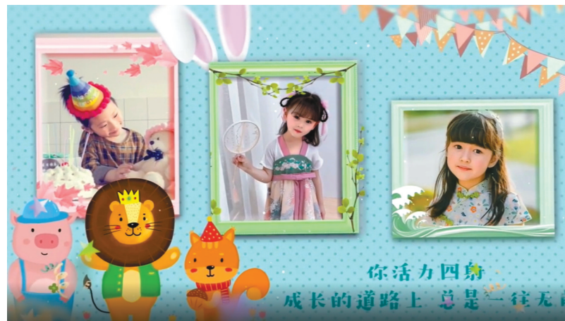
参加“封面宝贝兔be No.1”活动的萌娃。

截至目前,最小的参与者才刚刚出生13天,“我是抓住了年末小尾巴的虎宝宝,为大家辞旧迎新,希望大