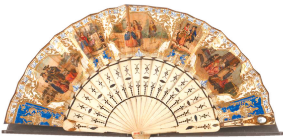
西洋人物故事图纸面兽骨折扇(19世纪)。广东省博物馆藏

子的视觉盛会。届时,漫步于展厅之中,在一把把精美的扇子上,可以看到迷人的西洋风情遇见浓厚的东方神韵所碰撞出的夺目光彩。