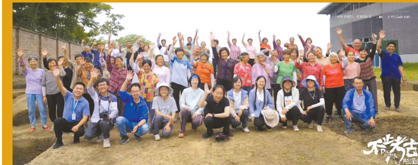
纪录片摄制组与三星堆发掘保护团队合影。

但这样的决心,注定了要去尘土瓦砾之中寻找。当主创团队抵达三星堆发掘现场之后,他们看到了考古人“接地气”的一面:比如指挥当地技工们挖土、拿着刷子清理文物上的尘土等等。与考古人打了一年交道,主创团队才意识到,这种日复一日的坚守,才是考古