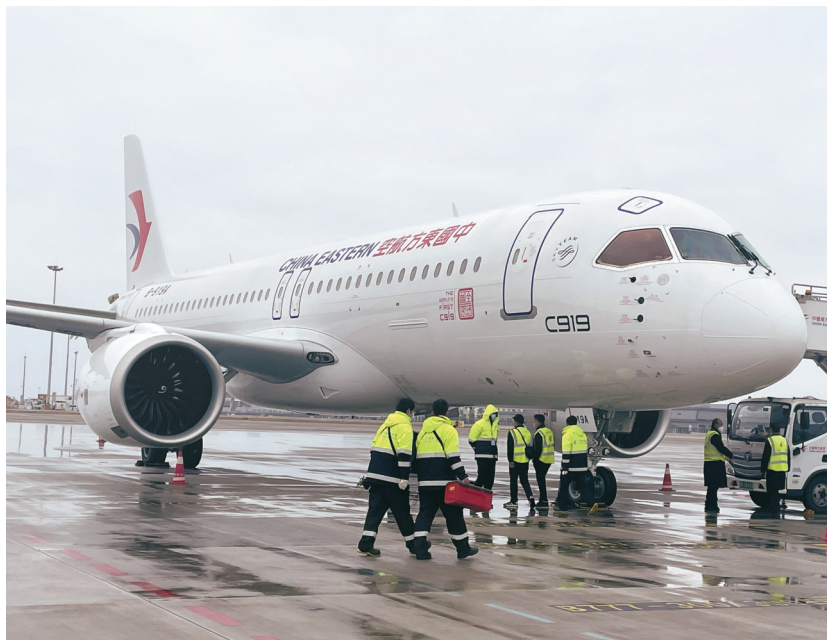
12月27日，东航全球首架C919国产大飞机抵达成都天府国际机场。

据悉，C919此次到成都主要是进行验证飞行。据飞常准APP数据显示，这架C919当天15时30分再次从成都天府机场起飞，于18时15分返回上海虹桥机场，单程空中飞行大约3个小时。