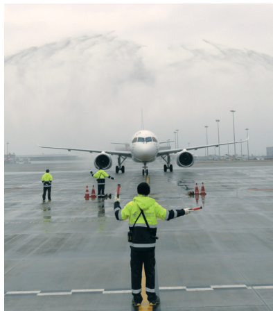
C919国产大飞机过“水门”。