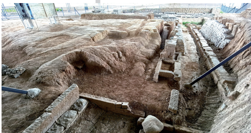
城坝遗址古城墙遗迹。