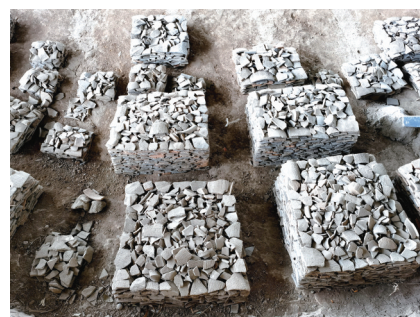
城坝遗址宕渠古城瓦当。

城。”北魏郦道元《水经注》载：宕渠县“古賸国也，今有賸城。县有渝水，夹水上下，皆賸民所居”。