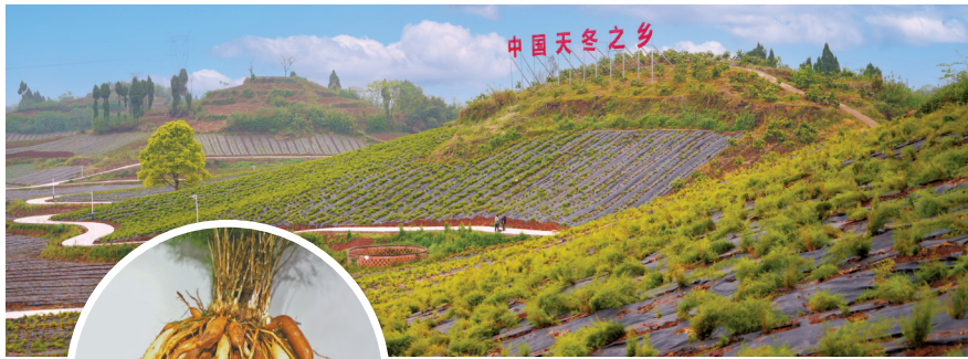
▲2021年,内江市东兴区被授予“中国天冬之乡”称号。 ◀可食用可入药的内江天冬。

东兴区是内江市唯一的革命老区,这里气温、日照、雨量、土壤等自然条件都非常适宜天冬种植,得天独厚的自然条件孕育出了道地药材——内江天冬。经检测,东兴区产出的成熟期天冬浸出物含量达94.15%以上,远高于全国其他地区产出的天冬,符合出口标准。