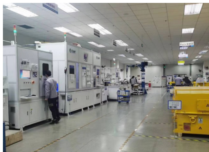
生产线上忙碌的员工。

目前,公司重点研发的方向是新旧电池混用,通过智慧电源管控系统,实现新旧电池混用。该类技术的应用场景广阔,将广泛应用于换电模式、租赁模式等领域。