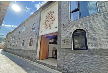
“开哥”在云南腾冲开的民宿经营情况正在好转。