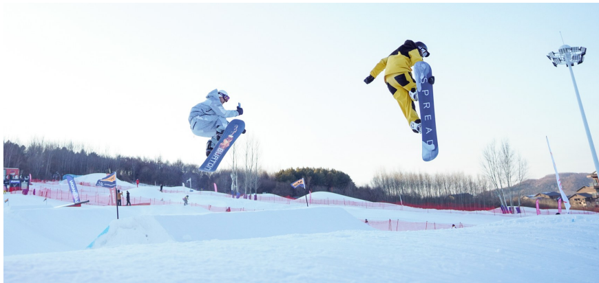
滑雪爱好者在吉林V-PARK地形公园挑战跳台滑雪。

“新十条”发布后,各旅游平台上的出行搜索量迅速增长。其中,携程平台上的机票瞬时搜索量猛增160%;春节前夕的机票搜索量暴涨至3年以来的最高点。同程旅行平台机票瞬时搜索量较前