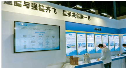
成渝地区双城经济圈展区展示城市显示产业发展情况。