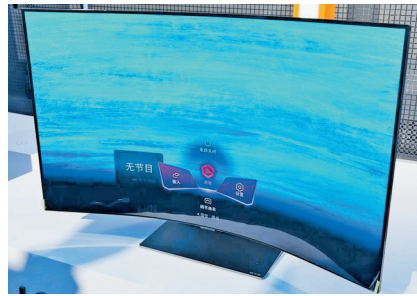
可弯曲的游戏电视。