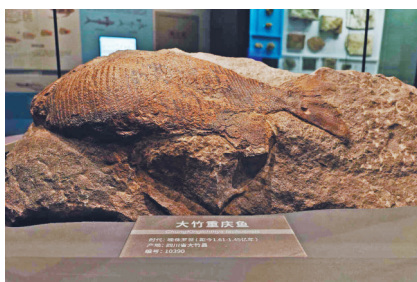
镇馆之宝:大竹重庆鱼。

位于一楼“地质环境厅”的“隆昌铁陨石”也是一件明星文物,《隆昌县志》十二卷中记载:“相传明邑人熊球未遇时,以买草为生,于道观坪草野内得一物,紫色,似石非石,似铁非铁,扣之有声”,说的就是这位“天外来客”。它重约158.5公斤,于明朝年间“造访”地球,清朝乾隆年间被人挖掘出来当作“神物”供奉,1972年被成都地质学院(现成都理工大学)收藏,是四