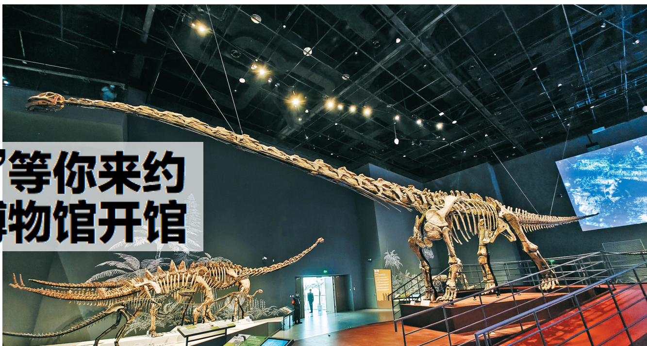
镇馆之宝:合川马门溪龙。

11月22日,华西都市报、封面新闻记者提前探访这座自然博物馆,合川马门溪龙化石、大竹重庆鱼化石、隆昌铁陨石这三大镇馆之宝十分吸睛。截至记者发稿前,成都自然博物馆票务系统中本周末两天的门票已经全部约满,火爆程度可见一斑。