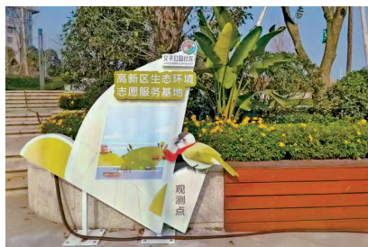
生态环境志愿服务基地。