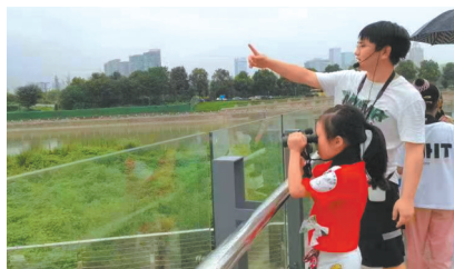
小朋友用望远镜观鸟。