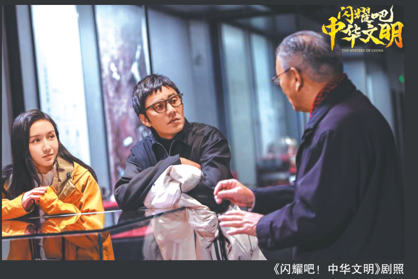
《闪耀吧！中华文明》剧照