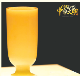
节目中出现的文物