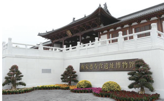
南宋德寿宫遗址博物馆外景。

原展示的宋韵风格的宫殿建筑组群，走进殿宇，领略南宋宫廷生活场景，也可以近距离了解遗址现状，还能在相关展览中系统了解南宋文化。