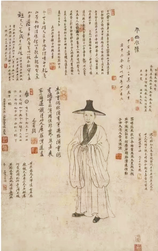
朱奎(八大山人)画像。南昌八大山人纪念馆藏