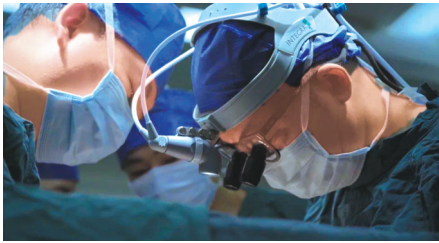
纪录片《打开一颗心》剧照