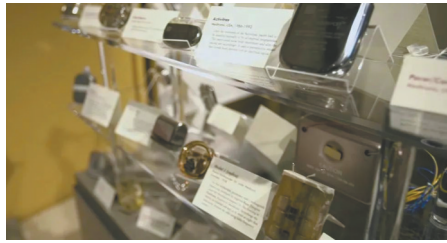
各式各样的心脏起搏器

“心脏作为人类最重要的器官之一，却是外科手术领域中最晚触及的领域。人们对心脏本体的探索以及心脏医疗科技飞速的进步，都引发我们极大的兴趣，希望能够系统呈现。”《打开一颗心》收官后不久，封面新闻独家采访到该片的总导演柯敏，聊起这部纪录片创作的初衷和幕后故事。