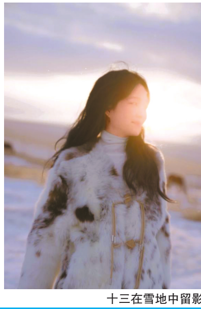
十三在雪地中留影