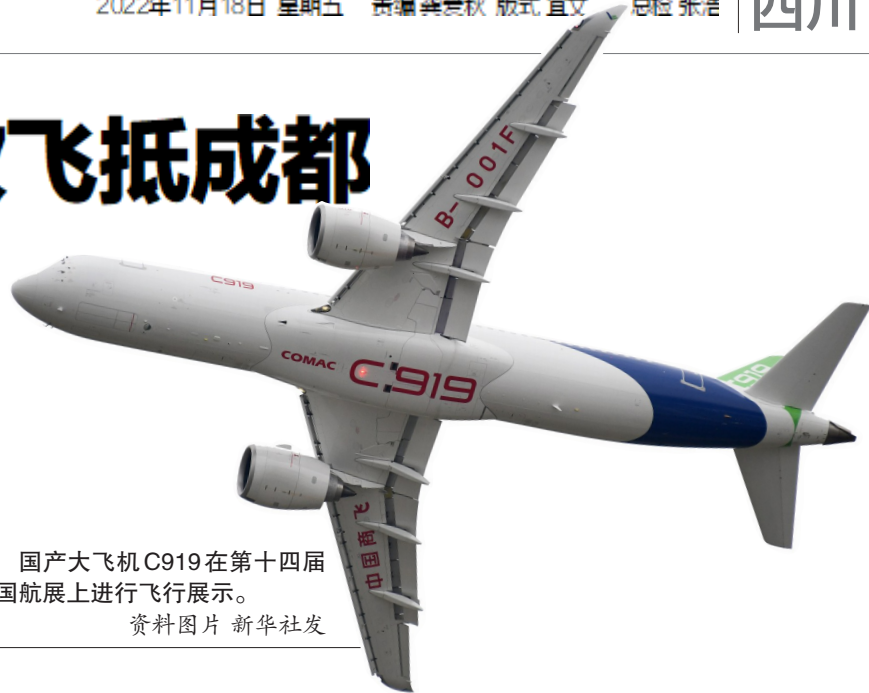
国产大飞机C919在第十四届中国航展上进行飞行展示。

C919大飞机与四川有着紧密的联系,其客舱核心控制系统、信息系统、机载娱乐系统等都是“成都造”,2019年,中国商飞大飞机示范产业园在成都双流开园。