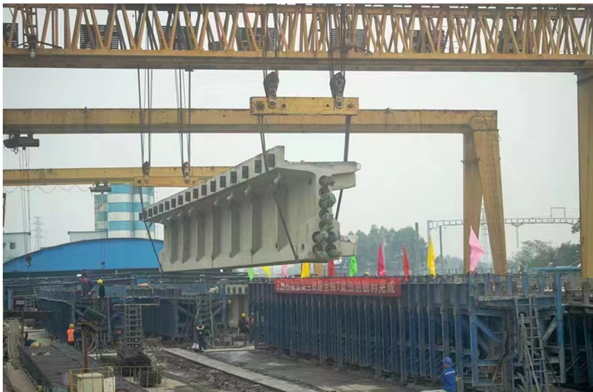
成兰铁路什邡制梁场最后一批T梁完成浇筑。

宝才介绍,为保证顺利完成成兰铁路全线T梁的生产供应任务,中铁八局组织编制了切实可行的专项施工方案,在原材料质量、安全措施、现场施工等方面严格把关,对现场预制梁模板安装、机械设备调试、砼浇筑等环节进行了全面检查和跟踪,对新进场劳务人员开展了安全培训和防疫措施宣传,并持续监测在场人员健康状况,积极做好疫情防控,有序