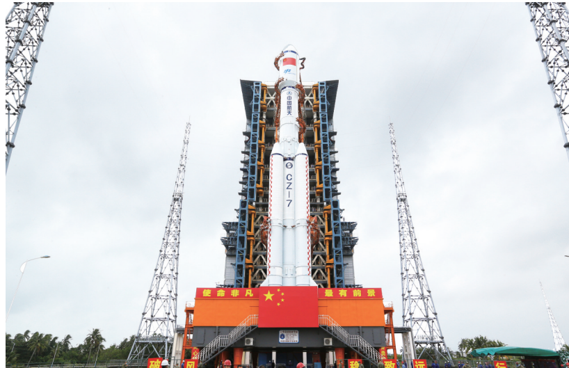
11月9日,天舟五号货运飞船与长征七号遥六运载火箭组合体转运至发射塔架。

据介绍,神舟十四号和神舟十五号两个乘组均由三名航天员组成。待神舟十五号载人飞船成功发射任务完成后,将首次实现轨乘组轮换,实现不间断有人驻留。两个乘组6名航天员将共同在轨驻留5到10天。