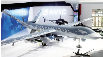
11月6日,翼龙-3无人机亮相航展静态展示区。

天空是国家安全的空中防线,是人民出行的安全通道。空管守护万里苍穹,共筑天路通途。在本届航展上,空军首次设立空管展厅,向社会公众介绍“空中交警”,宣讲空管知识,让人民群众头顶的家园更加安宁祥和。 据新华社