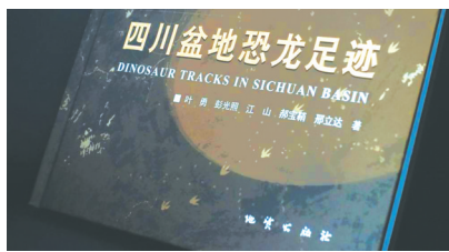
《四川盆地恐龙足迹》

近年来，自贡恐龙博物馆积极加强科研平台建设，加强科研创新，成绩斐然。2017年以来先后成功申报立项和开展现代古生物学与地层学国家重点实验室开放课题3项、自然资源部地层与古生物重点实验室开放课题1项、四川省国土资源厅科研课题1项、四川省文物局重点科研课题1项、自贡恐龙博物馆