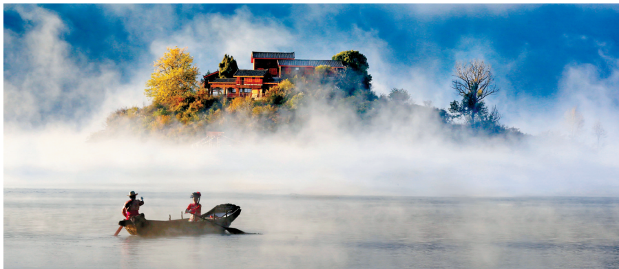
泸沽湖王妃岛