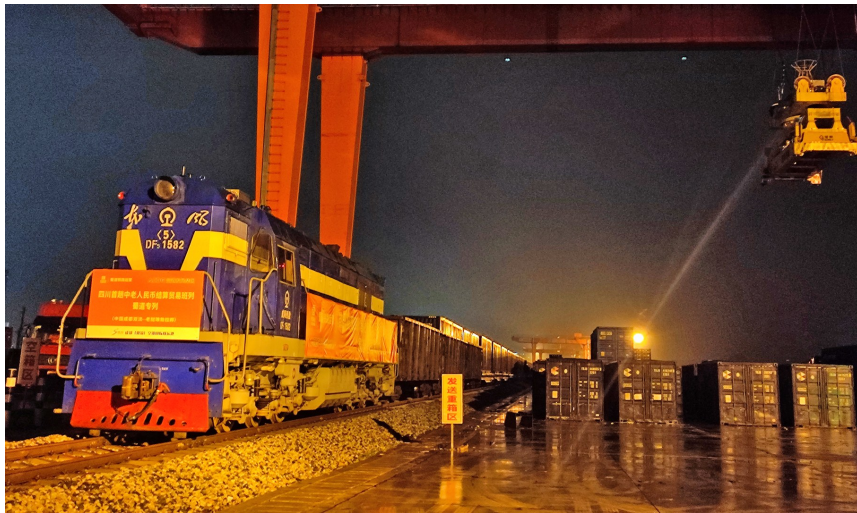
10月29日凌晨,四川首趟中老通道“跨境人民币结算”班列发车。

人民币结算的优势是什么?成都空港城市发展集团有限公司相关负责人表示,人民币结算能为外贸企业规避汇率风险,减少中外币结算的金融成本,降低企业的财务成本,提高企业资金运转效率。