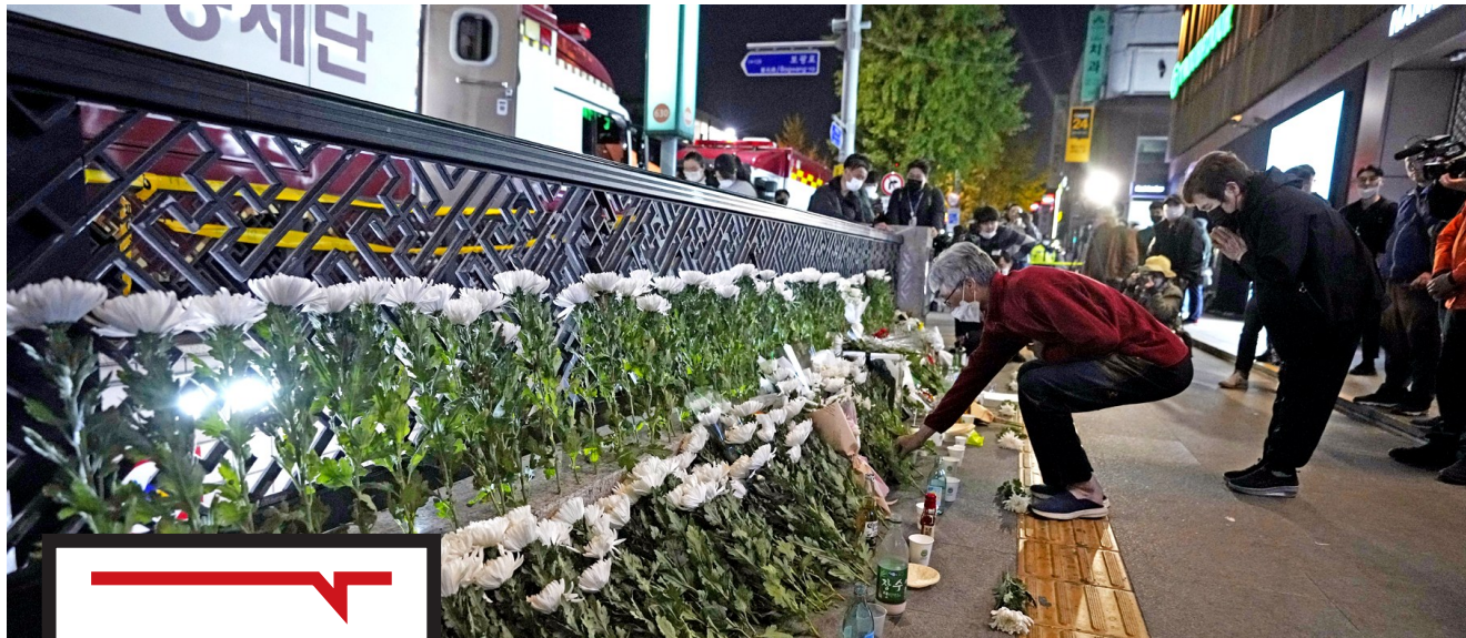
10月30日，人们在韩国首尔踩踏事件现场附近悼念。

几年前大热的韩剧《梨泰院Class》里说：大多数人会为了庆祝万圣节到梨泰院来。剧中还有不少万圣节庆祝活动的场景。但现实没有剧中那么美好。10月29日晚，韩国首尔龙山区梨泰院洞发生严重踩踏事故。当地媒体称，这是韩国继2014年“世越”号客轮沉没以来遇难者人数最多的一次事故。