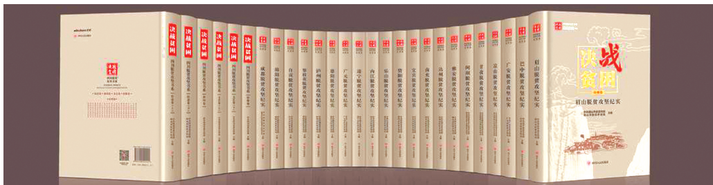
《决战贫困——四川脱贫攻坚书系》

“奋进新时代”主题成就展上，《决战贫困——四川脱贫攻坚书系》和报告文学作品《悬崖村》等川版图书，在四川展区现场展出。