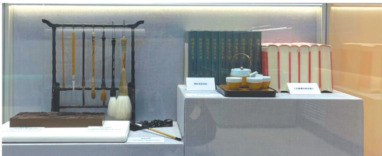
《辑补旧五代史》在北京展览馆展出。