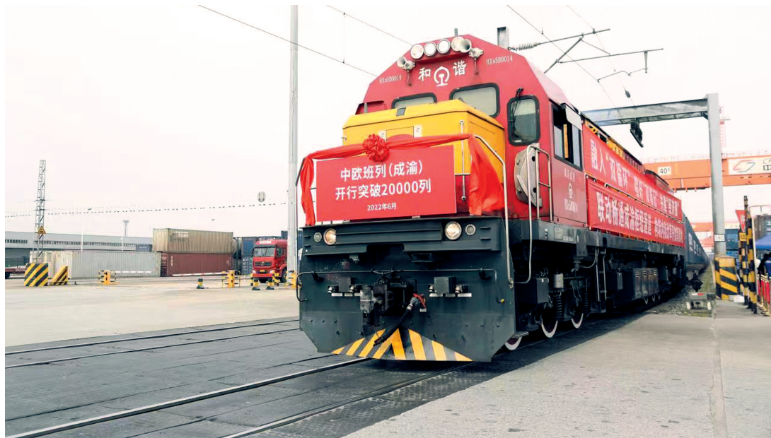
截至今年6月30日，中欧班列(成渝)开行突破20000列。

的汽车零部件、电子产品等物品比较多，后来车上有了红酒、牛肉、咖啡、四川土特产以及我们成都中欧班列独有的绿植。”据统计，集装箱货源品类覆盖电子、机械、汽车及配件、食品饮料、衣物鞋帽等上千种产品，涵盖了班列沿线国家人民生产生活的多个方面。