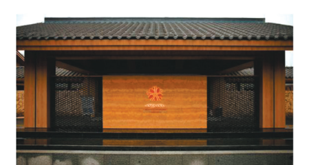
成都温江悦椿酒店实景图