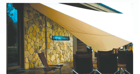
牛啤堂精酿文化体验中心