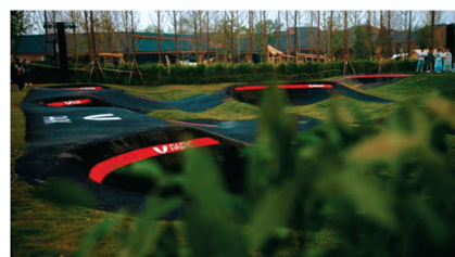
温江悦椿酒店悦乐园Vpark无动力乐园

制餐厅等业态。该酒店聚合悦榕奢华度假领域的管理经验和万科对家庭度假场景的资源整合能力，以全时四季、家庭友好、宠物友好为特色，目标发展为最受成都年轻一代消费者喜爱的友聚度假天