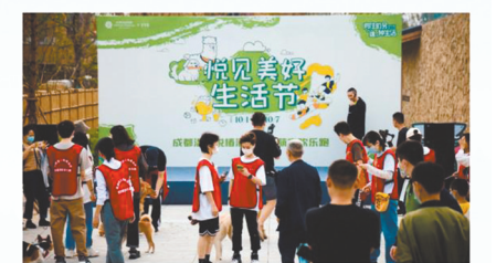
悦见美好生活节现场