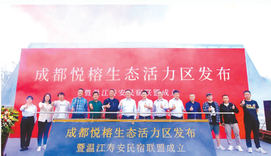
10月1日，成都悦榕生态活力区启动暨温江寿安民宿联盟成立仪式现场

成都温江悦椿酒店是成都首家悦榕系酒店，建筑面积约2.25万平方米，总客房数153间，包含多功能厅、酒吧、全日