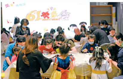
博物馆融入百姓美好生活。图为文博周末儿童博物馆活动。