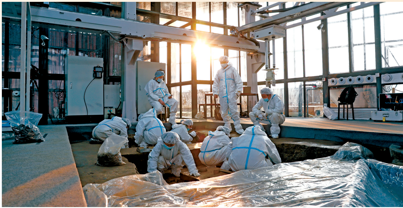
三星堆祭祀区新一轮发掘取得巨大收获。图为考古工作者在发掘舱中工作的场景。

作为文物资源大省，四川文物的数量、等级、价值均位于全国“第一方阵”。十年来，四川的文物资源家底不断充实，