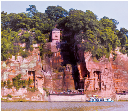
以文物为依托的文旅景区成为靓丽的名片。图为乐山大佛。