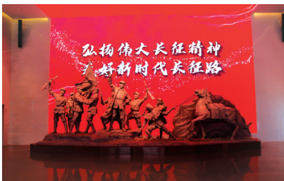
革命文物保护成果显著。图为“红军长征在四川”展览在雅安举办。

先后新增第七批、第八批全国重点文物保护单位102处、32处，全省全国重点文物保护单位数量增至262处；省人民政府核定公布第八批、第九批省级文物保护单位484处、282处，全省省级文物保护单位数量增至1215处，国、省级文物保护单位数量分别增长104%、133%。