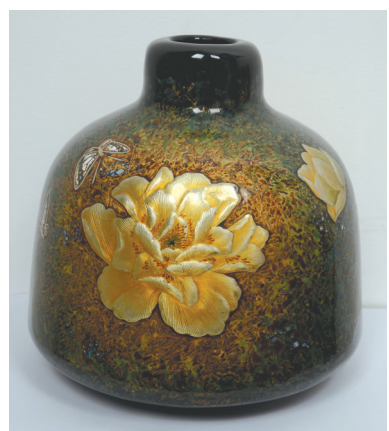
尹利萍作品馨香花瓶