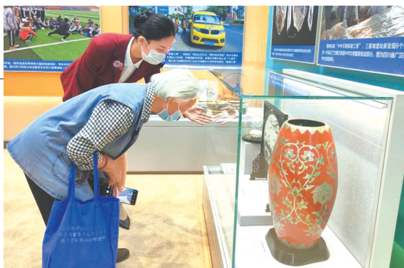
观众在讲解员带领下欣赏牡丹宝相瑞叶花瓶。