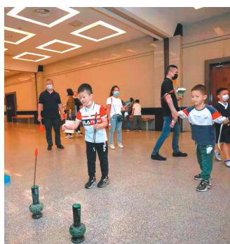
观众在川博体验投壶。