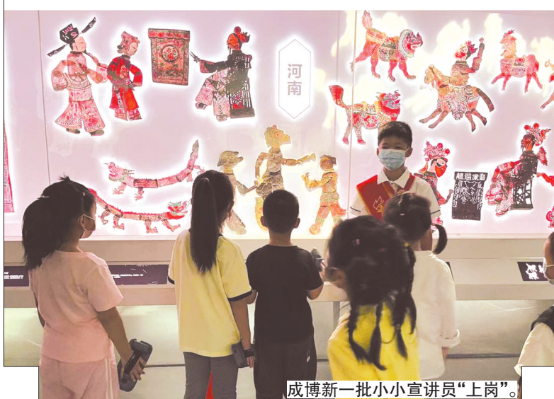
成博新一批小小宣讲员“上岗”。

开经验交流会，确定重点扶持的50个优秀项目，成博名列其中，并在第九届“博博会”期间集中展示。