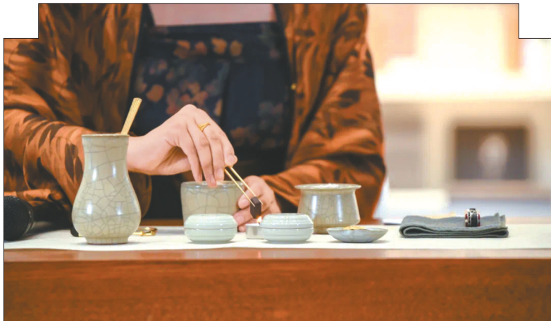
成都博物馆举办雅集。

今年9月1日，由中宣部志愿服务促进中心、国家文物局博物馆与社会文物司共同主办的“青少年中华文物我来讲”博物馆志愿服务项目在河南郑州召