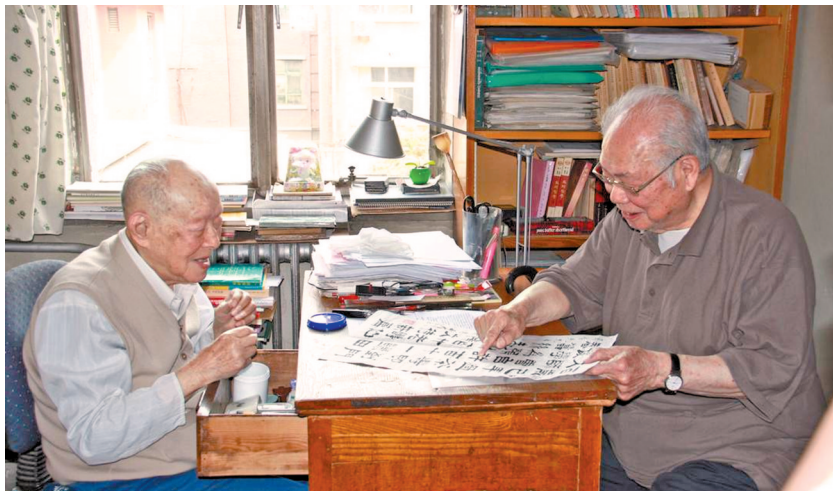
2011年,马识途在北京周有光家中交谈。

2022年6月,一本由作家慕津锋编、马识途著的文集《老马识途说》,由人民出版社出版。该书将马识途对文学创作、阅读之道、书法本质等课题的思考进行系统展现,称得上是一部全面了解文坛传奇马识途文学世界的入门书。