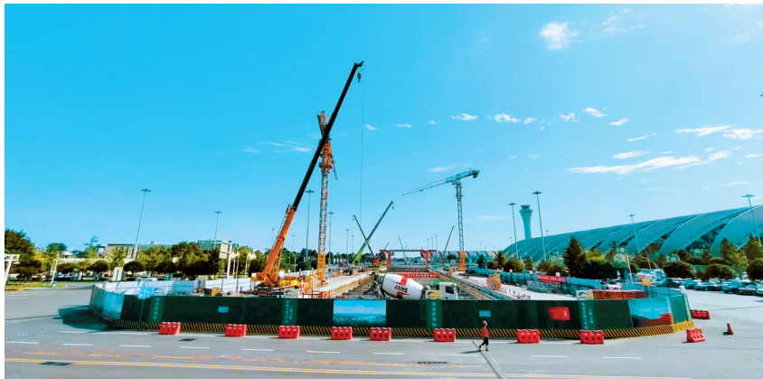
成都轨道交通19号线二期项目建设现场。

其中,成都轨道交通8号线二期工程顺利实现龙潭寺站-同乐站右线盾构始发,龙潭立交站-龙潭寺站盾构区间右线、圣灯公园站-龙潭立交站盾构区间左线贯通;13号线一期三官堂站-九