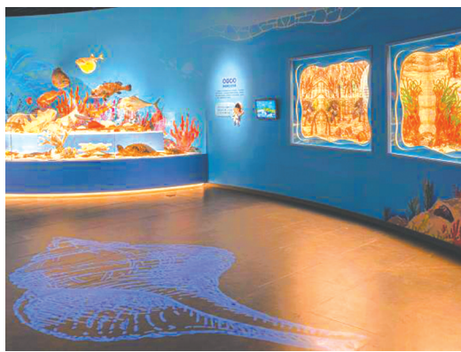
金沙遗址博物馆神奇宝“贝”——奇妙的贝类世界