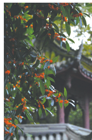
桂花的芬芳溢满整个草堂。