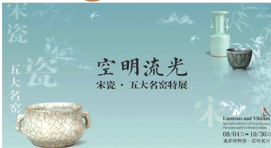
成都博物馆空明流光——宋瓷·五大名窑特展

四川博物院、成都博物馆、金沙遗址博物馆、杜甫草堂博物馆、武侯祠博物馆、永陵博物馆于9月19日起陆续恢复开放,接待人次超过博物馆最大承载量75%的情况下将暂停入馆。金秋的丹桂,云端的展览,都将在线下与观众见面。