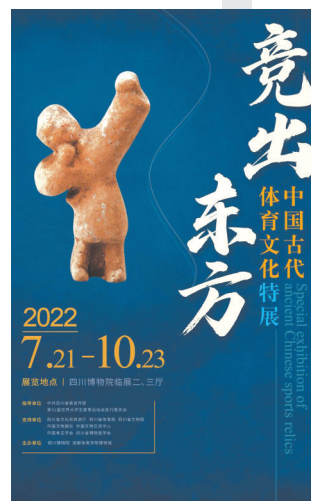
四川博物院“竞出东方——中国古代体育文化特展”

所有观众入馆时须与他人保持1米间距,佩戴好口罩,出示身份证原件、健康码、行程码、48小时内核酸检测阴性证明,并配合工作人员进行体温测量和实名登记,体温无异常者方可入馆。