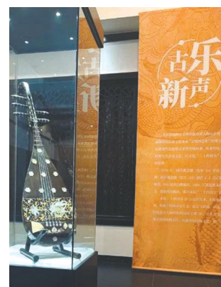
永陵二十四伎乐美学展