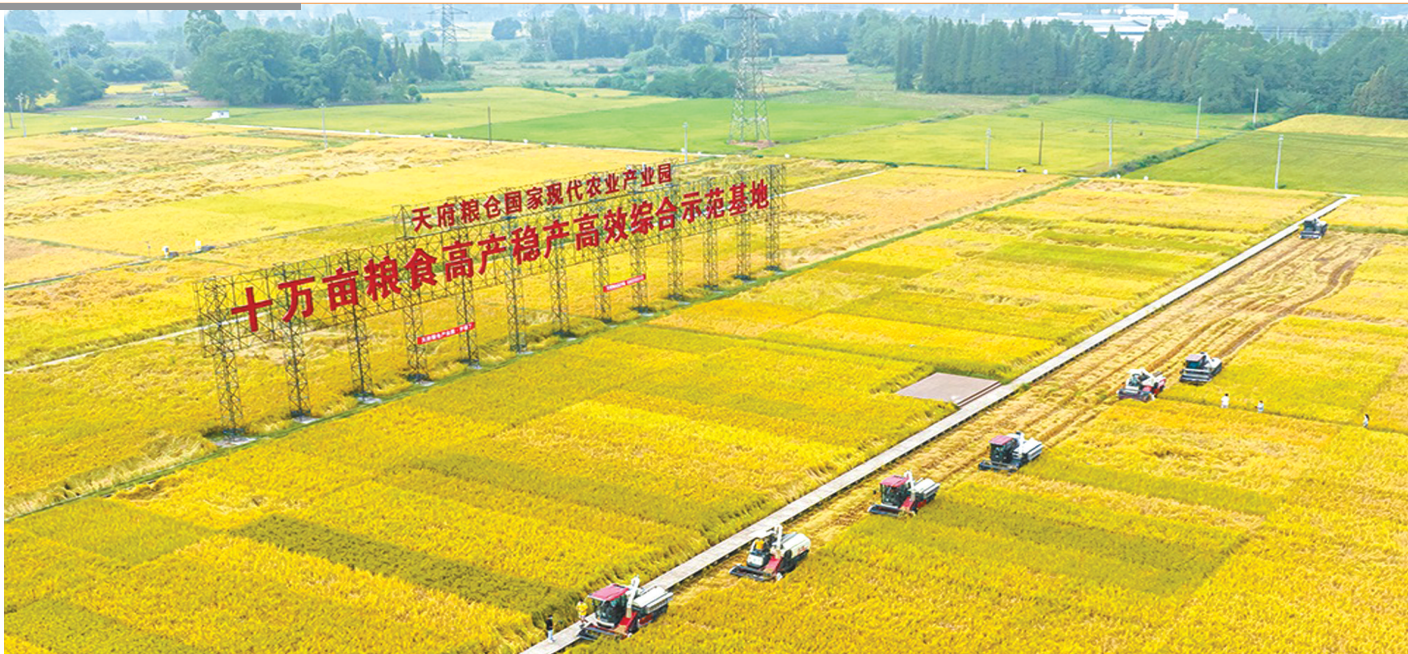
位于成都崇州的天府粮仓国家现代农业产业园又到丰收季。