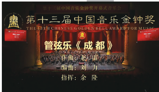
中国爱乐乐团演奏《成都》