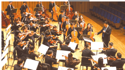
成都交响乐团演奏《成都》