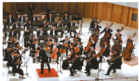
四川交响乐团演出现场。