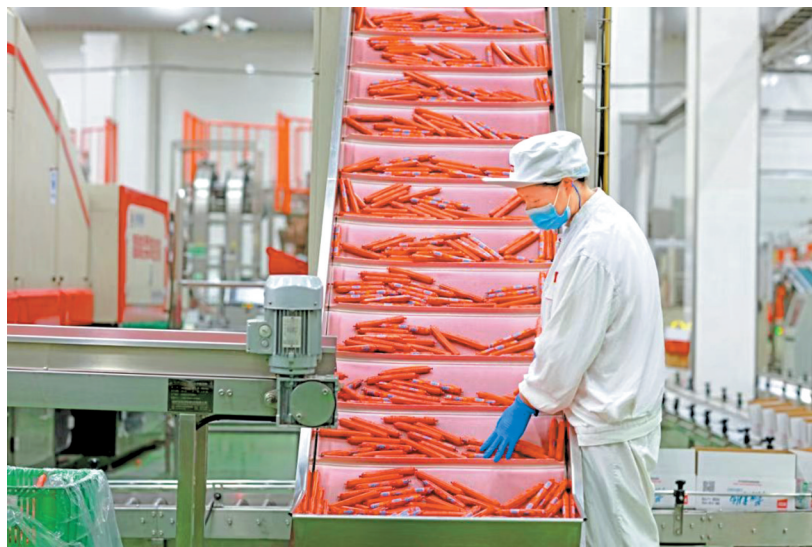
美好食品新津工厂13天生产2700吨肉制品。

另一方面,面对企业多场景防疫需求,有关方面提供了诸多方便。例如,在帮助企业实现云上办公和现场办公相结合上,电信、移动等运营商充分发挥信息化技术与服务优势,通过云电脑、云桌面等应用进行保障。