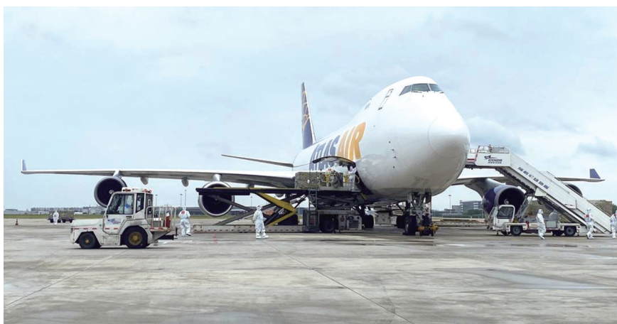
首架成都至北美货运航班在双流国际机场吞吐货物。

吨,位居全球空运代理企业第七位,中国空运代理企业第一位,能为全球客户提供多样化、全段式的铁路运输及供应链服务。此前,该公司在成都只运营过全货机临时包机业务。