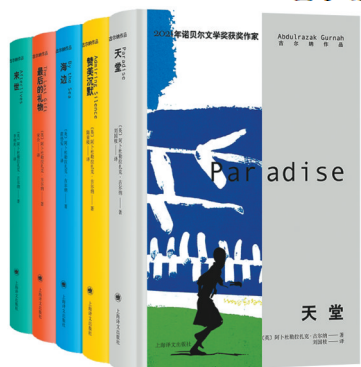
古尔纳的5部代表作

构建起自己的文学世界，不断拾起每一位离散者和异乡人的记忆，召唤并追寻埋藏在心灵深处的故土与他乡回忆。2021年，古尔纳因“对殖民主义的影响和身处不同文化、不同大陆之间鸿沟中