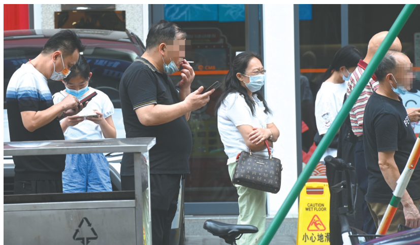
8月31日下午2点30分,成都玉双路核酸采样点,有人抽烟,有人不戴口罩。

8月31日中午12点40分,记者在现代医院(武侯院区)的检测点发现,有100多位市民在排队。点位有持续的广播提醒排队市民保持间距,大家也基本遵守了秩序。在黄码人员检测队伍中,一位市民边排队边吃雪糕,口罩拿在手上。一位牵着狗排队的男士,虽然戴了口罩,但是并没有遮住口鼻。还有两位男士,一边抽烟一边交谈。除此之外,该点位的路边还有卖手抓饼的流动摊位,一些市民在等候做核酸前,就在摊位前进了食。