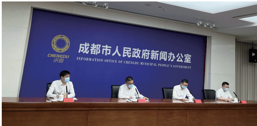
8月30日,成都市政府新闻办召开疫情防控新闻发布会。

提供延时服务。针对黄码人员核酸定点检测排队人数较多的问题,也将进一步优化定点检测机构,增设采样台位,切实降低黄码人员核酸检测排队等待时间。