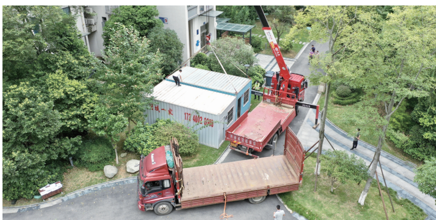
成都成龙大道某小区,集装箱应急房已吊装到位。