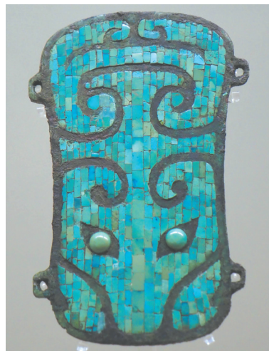
夏代晚期文物「镶嵌绿松石兽面纹牌饰」。