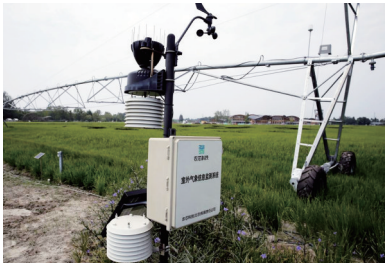
室外气象信息监测系统。

绍,通过这个平台可以管理大田环境、作物监测、智能灌溉、遥感监测、无人农机以及农事管理等六大板块。