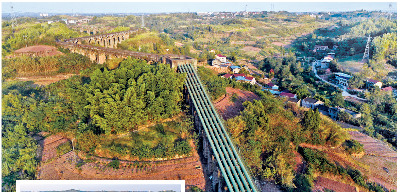
架设在空中的沱灌工程管道和渡槽。