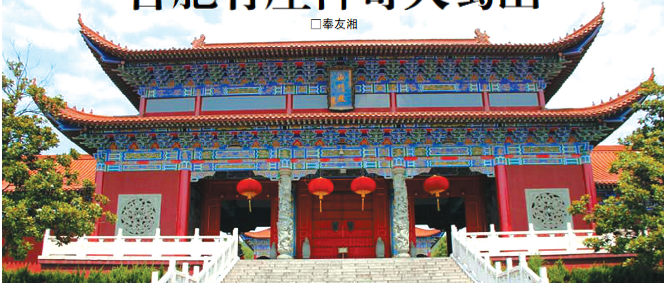
大蜀山开福寺山门殿。(资料图片)

天下之大，无奇不有。在安徽省合肥市中心城区，突兀、神奇地冒出一座林涛滚滚、葱茏苍翠的山——大蜀山。它酷似一顶巨大的锥形草帽，被扔在这一马平川之上。它绝世独立，恰似从天上飘然而降；它傲然隆起，又似乎地里喷薄而出。