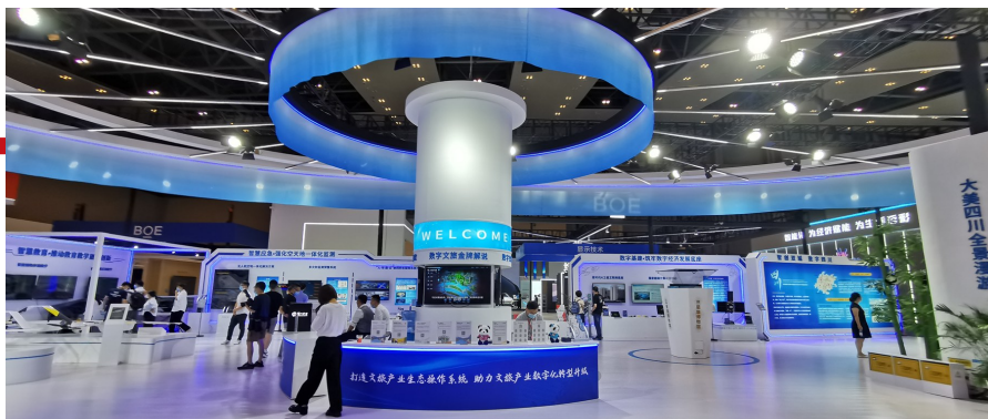
本次智博会期间,四川设立主题展区,主要展示数字基建、智慧应急、智慧教育、智慧医疗、智慧文旅五大数字化建设成果。