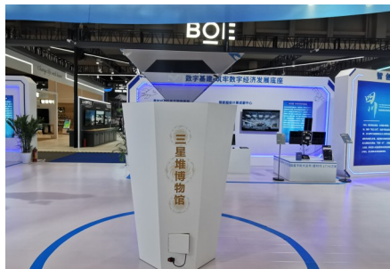
智慧文旅领域展示。

唱好“双城记”,共建经济圈。“推动成渝地区双城经济圈一体化发展,四川将以本次智博会为契机,携手重庆共建电子信息、消费品、装备制造等世界级产业集群。”现场相关负责人说。