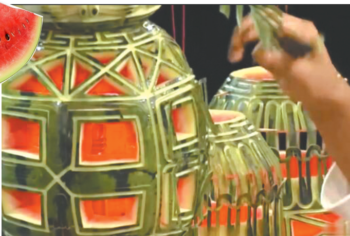
西瓜雕灯。视频截图

过，也写过论文，论证这些“西瓜籽”，其实或许都是粉皮冬瓜籽。因此，西瓜究竟是何时传入中国的，还得再议。