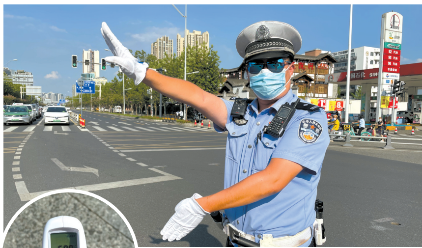
成都交警顶着烈日执勤。