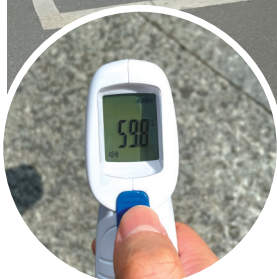
记者用测温枪在地表测得温度近60℃。