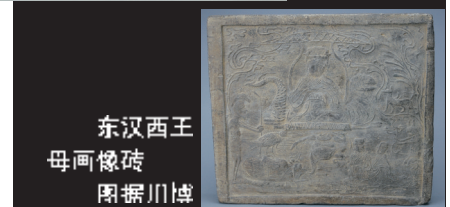
东汉西王母画像砖 图据川博