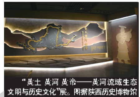
“黄土黄河黄帝——黄河流域生态文明与历史文化”展。图据陕西历史博物馆