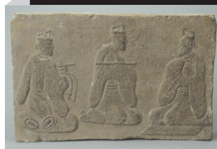
东汉讲经画像砖 图据川博