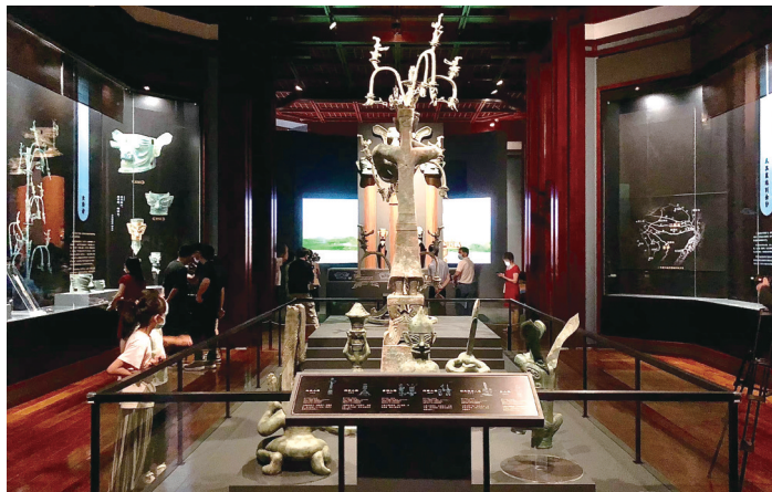
展览还原古蜀国祭祀场景。