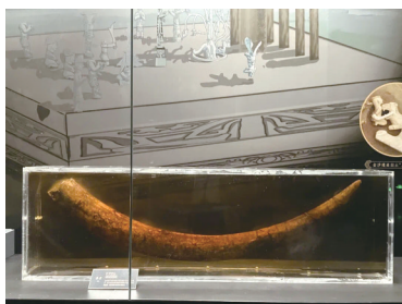
金沙遗址出土的象牙。

金沙送展的文物之中，既有商周时期的肩扛象牙人形纹玉璋、玉贝，也有石虎、石蛇、石跪坐人像、小石磬和象牙，与三星堆出土的文物相得益彰。