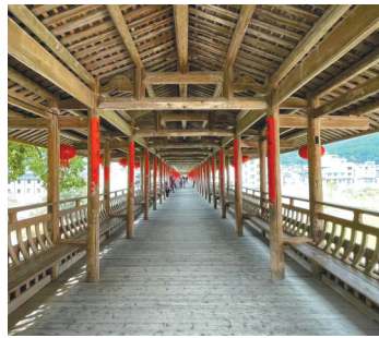
万安桥的木质结构。

山市的木廊古桥余庆桥被烧毁，事故原因是两个十一二岁的女孩在桥下点燃木棍玩火，不慎引燃桥内杂物，致木桥被引燃。几年后，余庆桥进行了修复。