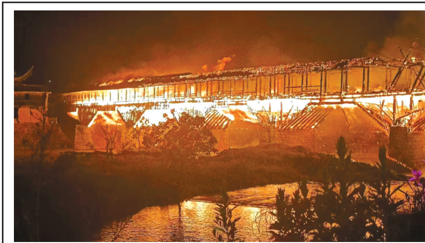
2022年8月6日晚，全国重点文物保护单位、中国现存最长木拱廊桥——福建宁德屏南万安桥突发大火，桥体烧毁坍塌。

2006年，屏南县的国家级重点文物保护单位百祥桥突遇大火，一个多小时后，这座建于宋代的“江南第一险”木拱廊桥毁于一旦，木质桥身全部被烧塌，掉进27米深的峡谷里。2011年，位于武夷