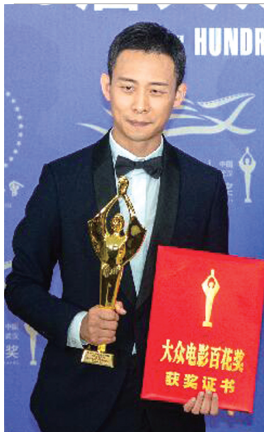
张译获得“百花奖”最佳男主角奖。